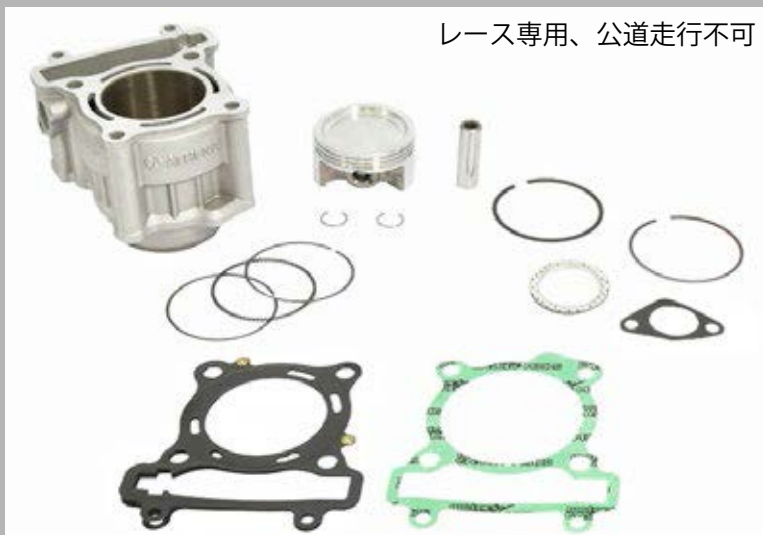
レース専用、公道走行不可